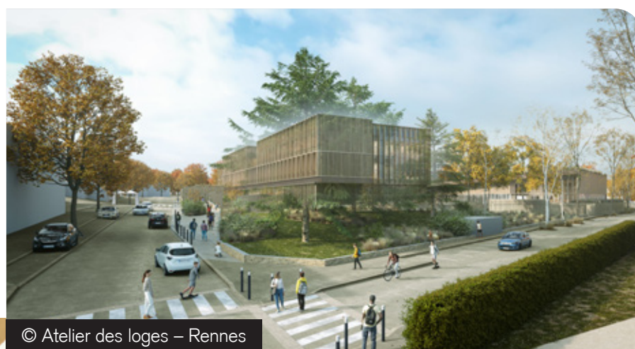
© Atelier des loges – Rennes